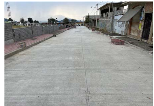
FABRICACIÓN DE BANQUETAS DE ADOQUIN ROJO DE DIMENSIONES 20X20CM, DE 8CM DE ESPESOR JUNTEADA CON ARENA Y REMATES DE CONCRETO EN DONDE SEA NECESARIO, INCLUYE: CAMA DE ARENA.