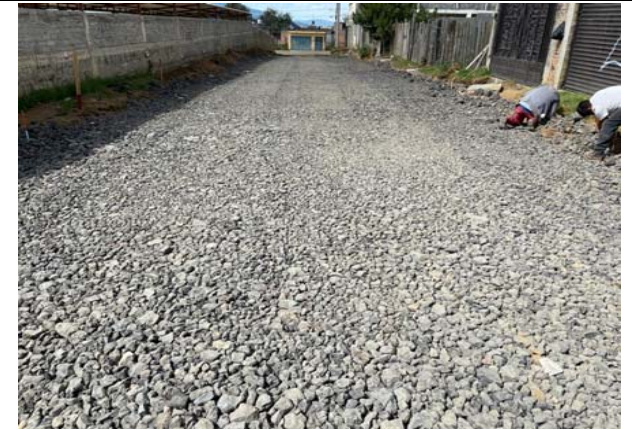
SUMISTRO, TENDIDO Y COMPACTACIÓN DE CAPA DE SUB-BASE (FILTRO), DE 30CMDE ESPESOR, EXTENDIDO CON MOTOCONFORMADORA Y BANDEADO CON RODILLO LISO EN CAPAS DE 20CMS.