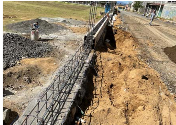
DALA O CADENA DE CERRAMIENTO DE CONCRETO SECCIÓN 0.15X0.30M CON FABRICACIÓN DE CONCRETO F'c=200 KG/CM2, AGREGADO DE 20MM, INCLUYE:CEMENTO, ARENA,GRAVA Y AGUA, EN REVENIMIENTO 8 A 10CM, CON REVOLVEDORA,1 SACO TROMPO Y MANO DE OBRA PARA SU FABRICACIÓN, ALTAS RESISTENCIAS.CIMBRA ACABADO COMÚN A 4 USOS, ARMADA CON VARILLAS DEL #3 (Ø3) DEL NÚMERO 25 (4U) Y ESTIROS A CADA 25CM DEL NÚMERO