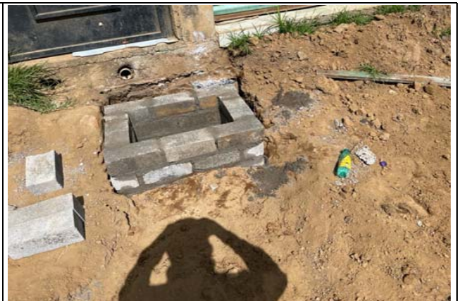
REGISTRO DE 40X60X80 CM. CON TABICÓN DE 10X13X28 CMS, JUNTEADO CON MEZCLA CEMENTO, ARENA 1:5 ACABADO PULIDO EN EL INTERIOR, SOBRESABASE DE PLANTILLA DE CONCRETO DE 5 CM Y CADENA DE SECCIÓN 10X12CM AGREGADO DE 20 MM, CEMENTO NORMAL, INCLUYE: MARCO Y CONTRAMARCO DE ANGULO DE FIERRO DE 1 1/4" X 50000 DE VOL TABICÓN DE CONCRETO 100 KG/M3 AGREGADO DE 20MM CEMENTO