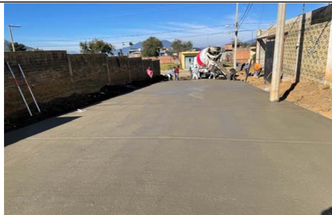
SUMINISTRO Y COLOCACIÓN DE PAVIMENTACIÓN DE CONCRETO HIDRÁULICO PREMEZCLADO DE 15CM DE ESPESOR F'C=250 KG/CM2, REFORZADO CON MALLA ELECTROSOLDADA 6X6-10/10, VIBRADO MEDIANTE UN VIDRADOR TIPO CHICOTE,INCLUYE: CIMBRA Y DESCIMBRA COMÚN EN FRONTERAS, CORTE CON DISCO DE DIAMANTE.