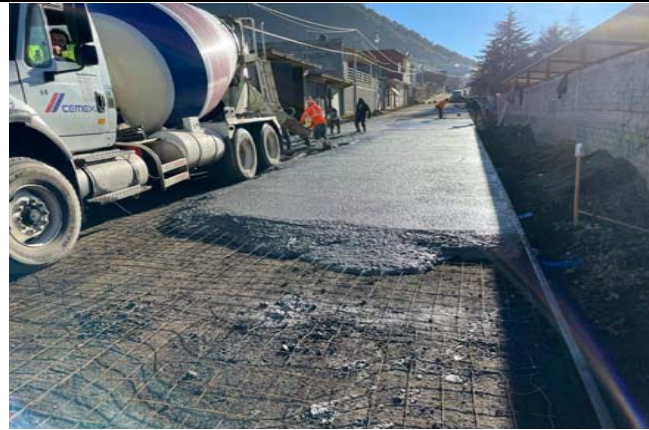
SUMINISTRO Y COLOCACIÓN DE PAVIMENTACIÓN DE CONCRETO HIDRÁULICO PREMEZCLADO DE 15CM DE ESPESOR F'C=250 KG/CM2, REFORZADO CON MALLA ELECTROSOLDADA 6X6-10/10, VIBRADO MEDIANTE UN VIDRADOR TIPO CHICOTE,INCLUYE: CIMBRA Y DESCIMBRA COMÚN EN FRONTERAS, CORTE CON DISCO DE DIAMANTE.