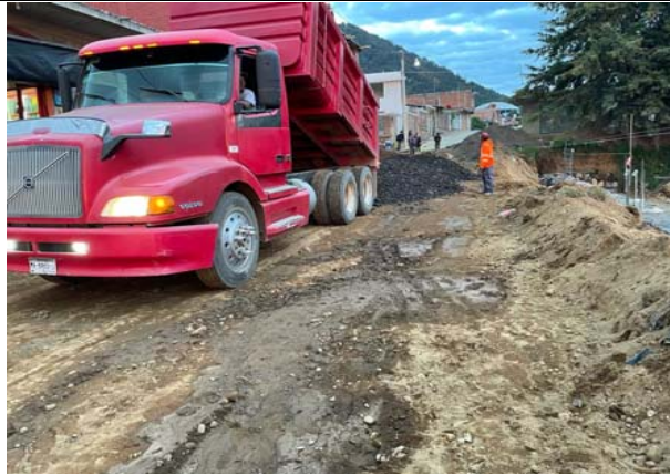
ACARREO DE MATERIAL PRODUCTO DE LA EXCAVACIÓN A TIRO LIBRE O DONDE INDIQUE SUPERVISIÓN, INCLUYE: CARGA Y DESCARGA A MAQUINA FUERA DE LA OBRA.