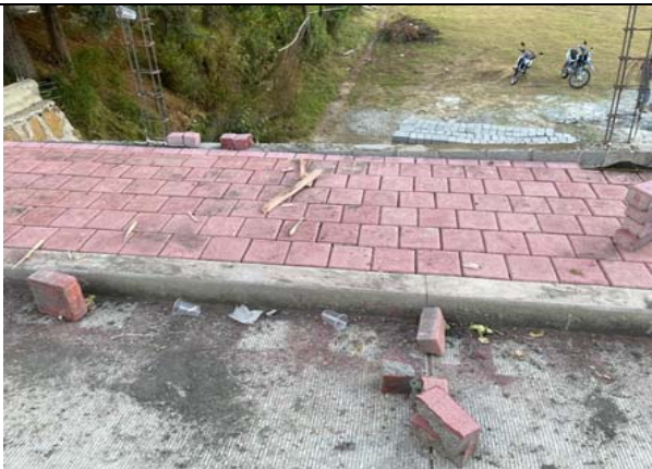
FABRICACIÓN DE BANQUETAS DE ADOQUIN ROJO DE DIMENSIONES 20X20CM, DE 8CM DE ESPESOR JUNTEADA CON ARENA Y REMATES DE CONCRETO EN DONDE SEA NECESARIO, INCLUYE: CAMA DE ARENA.