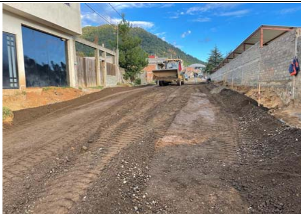
SUMISTRO, TENDIDO Y COMPACTACIÓN DE CAPA DE BASE HIDRÁULICA, DE 20CMDE ESPESOR, ELABORADA CON "TEZONTLE-TEPETATE" EN PORCIÓN 85-15% RESPECTIVAMENTE, AL 95% P.V.S.M. INCLUYE: BANDEADO CON RODILLO LISOEN CAPAS DE 20CM, MATERIAL DE PRESTAMO DE BANCO, REGALIAS Y ACARREO.