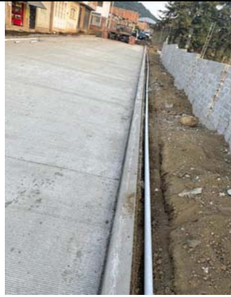
TUBO PVC HID. RD 26-11 KG/CM2-TRAMO 6 MTS.2" INCLUYE: MATERIAL, MANO DE OBRA, HERRAMIENTA DE CORTE Y TODO LO NECESARIO PARA LA CORRECTA EJECUCIÓN DEL P.U.O.T.