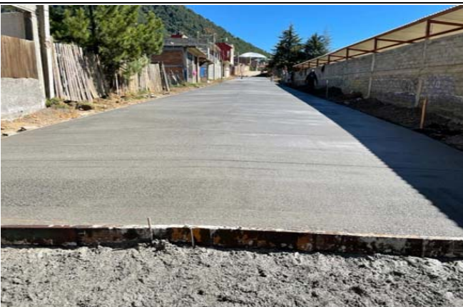
SUMINISTRO Y COLOCACIÓN DE PAVIMENTACIÓN DE CONCRETO HIDRÁULICO PREMEZCLADO DE 15CM DE ESPESOR F'C=250 KG/CM2, REFORZADO CON MALLA ELECTROSOLDADA 6X6-10/10, VIBRADO MEDIANTE UN VIDRADOR TIPO CHICOTE,INCLUYE: CIMBRA Y DESCIMBRA COMÚN EN FRONTERAS, CORTE CON DISCO DE DIAMANTE.