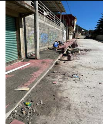
FABRICACIÓN DE BANQUETAS DE ADOQUIN ROJO DE DIMENSIONES 20X20CM, DE 8CM DE ESPESOR JUNTEADA CON ARENA Y REMATES DE CONCRETO EN DONDE SEA NECESARIO, INCLUYE: CAMA DE ARENA.