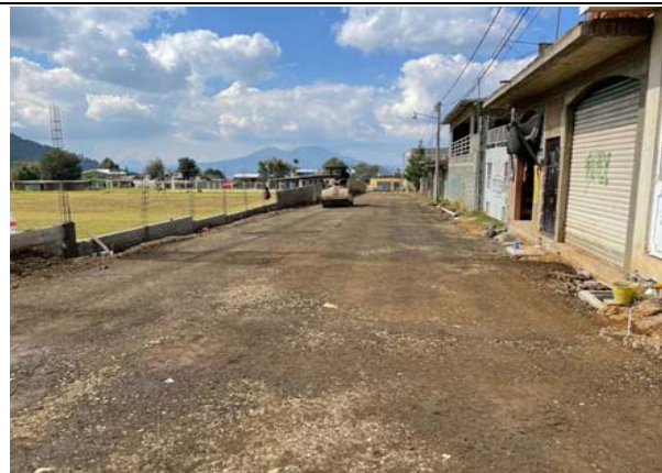
SUMISTRO, TENDIDO Y COMPACTACIÓN DE CAPA DE BASE HIDRÁULICA, DE 20CMDE ESPESOR, ELABORADA CON "TEZONTLE-TEPETATE" EN PORCIÓN 85-15% RESPECTIVAMENTE, AL 95% P.V.S.M. INCLUYE: BANDEADO CON RODILLO LISOEN CAPAS DE 20CM, MATERIAL DE PRESTAMO DE BANCO, REGALIAS Y ACARREO.