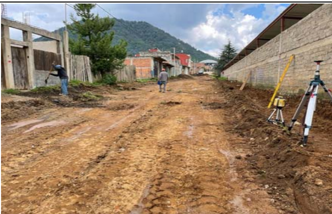
EXCAVACIÓN DE CAJA PARA CIMENTACIÓN EN TERRENO TIPO "B" POR MEDIOS MANUALES CON UNA PROFUNDIDAD DE 1.00M PARA MEJORAMIENTO DE TERRENO INCLUYE: ACARREO HASTA EL PRIMER KILOMETRO DE DISTANCIA FUERA DE LA OBRA.