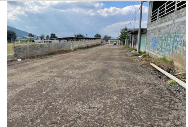
SUMISTRO, TENDIDO Y COMPACTACIÓN DE CAPA DE BASE HIDRÁULICA, DE 20CMDE ESPESOR, ELABORADA CON "TEZONTLE-TEPETATE" EN PORCIÓN 85-15% RESPECTIVAMENTE, AL 95% P.V.S.M. INCLUYE: BANDEADO CON RODILLO LISOEN CAPAS DE 20CM, MATERIAL DE PRESTAMO DE BANCO, REGALIAS Y ACARREO.