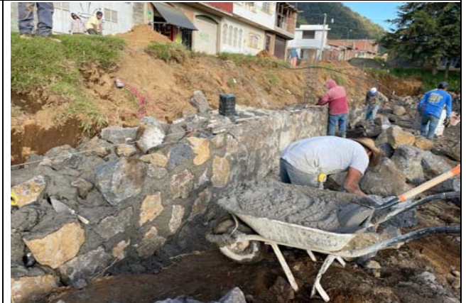
MAMPOSTERÍA PARA MURO DE CONTENCIÓN DE PIEDRA BRAZA CON UNA BASE DE 1.00M, UNA CORONA DE 0.30M, A UNA ALTURA PROMEDIO DE 3.20M JUNTEADO CON MEZCLA MORTERO-ARENA 1:4 INCLUYE: SUMINISTRO DE MATERIAL, MANO DE OBRA Y TODO LO NECESARIO PARA SU CORRECTA EJECUCIÓN.