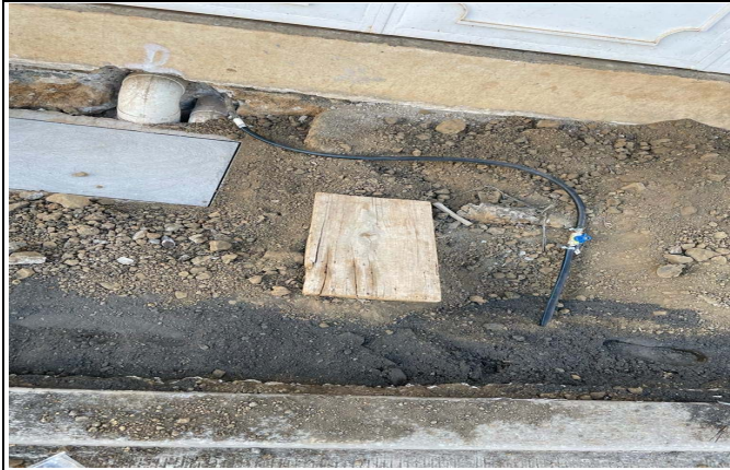
TOMA DOMICILIARIA DE AGUA POTABLE INCLUYE: EXCAVACIÓN EN CUALQUIER TIPO DE MATERIAL, AFINE DEL FONDO DE LA ZANJA, PLANTILLA DE 10CM DE CON ARENA, POLIDUCTO RD-26 DE 1/2", ABRAZADERA PARA TOMA DOMICILIARIA DE 1/2" A 4", ADAPTADORES DE BRONCE DE MARCA ARDA DE 1/2", VALVULA LIMITADORA MODELO XSB-60-13 1/2", ABRAZADERAS SIN EN DE 1/2" DE BANQUETA DE 1/2" DE DIAMETRO DE 6063 VUE ANCLADA