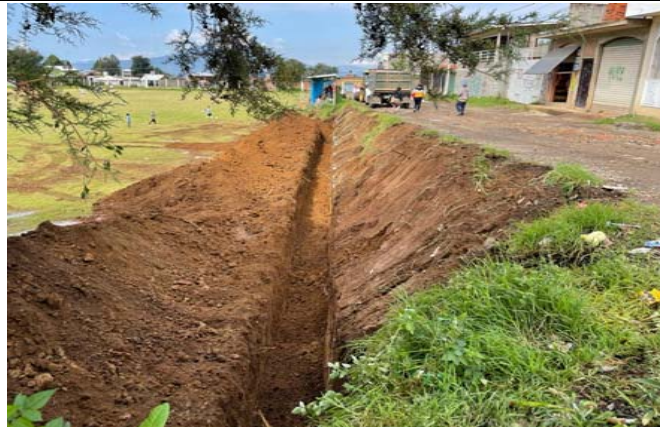
EXCAVACIÓN DE CAJA PARA CIMENTACIÓN EN TERRENO TIPO "B" POR MEDIOS MANUALES CON UNA PROFUNDIDAD DE 1.00M PARA MEJORAMIENTO DE TERRENO INCLUYE: ACARREO HASTA EL PRIMER KILOMETRO DE DISTANCIA FUERA DE LA OBRA.