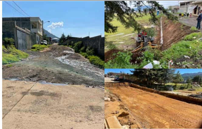
LIMPIA Y DESYERBE DEL TERRENO, INCLUYE: QUEMA DE HIERBA, Y ACOPIO DE BASURA, MANO DE OBRA, EQUIPO Y HERRAMIENTA.