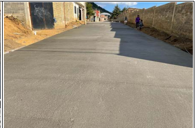
SUMINISTRO Y COLOCACIÓN DE PAVIMENTACIÓN DE CONCRETO HIDRÁULICO PREMEZCLADO DE 15CM DE ESPESOR F'C=250 KG/CM2, REFORZADO CON MALLA ELECTROSOLDADA 6X6-10/10, VIBRADO MEDIANTE UN VIDRADOR TIPO CHICOTE,INCLUYE: CIMBRA Y DESCIMBRA COMÚN EN FRONTERAS, CORTE CON DISCO DE DIAMANTE.