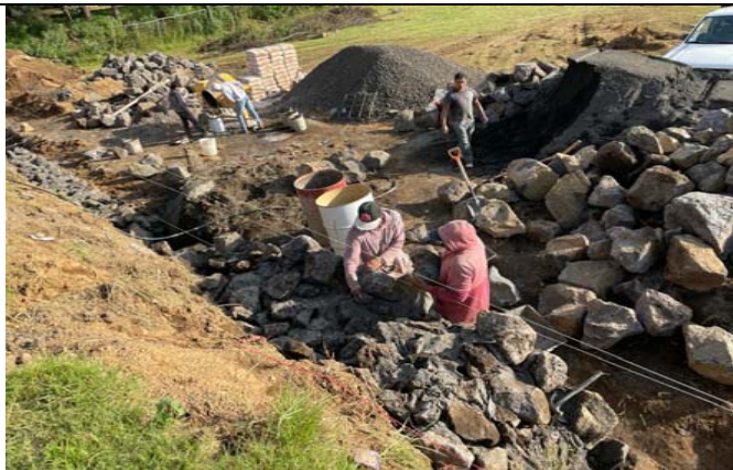
MAMPOSTERÍA PARA MURO DE CONTENCIÓN DE PIEDRA BRAZA CON UNA BASE DE 1.00M, UNA CORONA DE 0.30M, A UNA ALTURA PROMEDIO DE 3.20M JUNTEADO CON MEZCLA MORTERO-ARENA 1:4 INCLUYE: SUMINISTRO DE MATERIAL, MANO DE OBRA Y TODO LO NECESARIO PARA SU CORRECTA EJECUCIÓN.