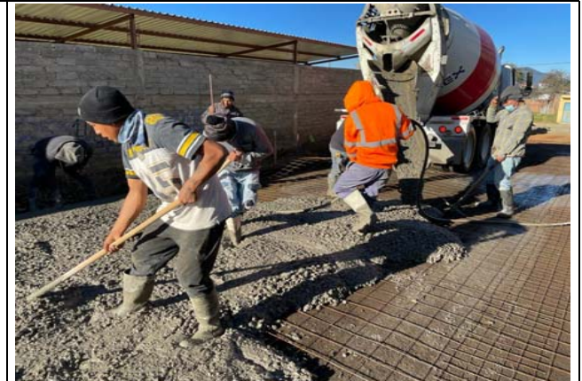
SUMINISTRO Y COLOCACIÓN DE PAVIMENTACIÓN DE CONCRETO HIDRÁULICO PREMEZCLADO DE 15CM DE ESPESOR F'C=250 KG/CM2, REFORZADO CON MALLA ELECTROSOLDADA 6X6-10/10, VIBRADO MEDIANTE UN VIDRADOR TIPO CHICOTE,INCLUYE: CIMBRA Y DESCIMBRA COMÚN EN FRONTERAS, CORTE CON DISCO DE DIAMANTE.